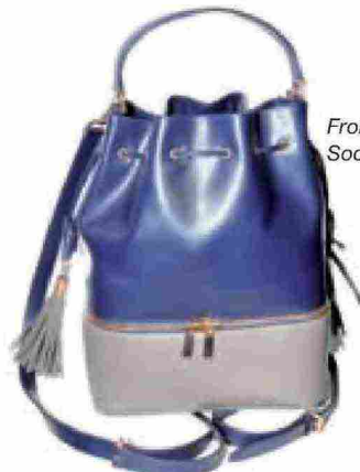
Front Row Society