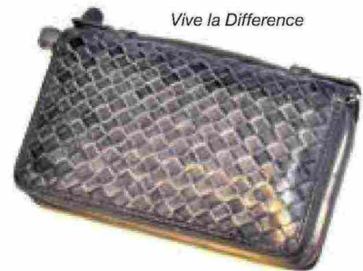
Vive la Difference