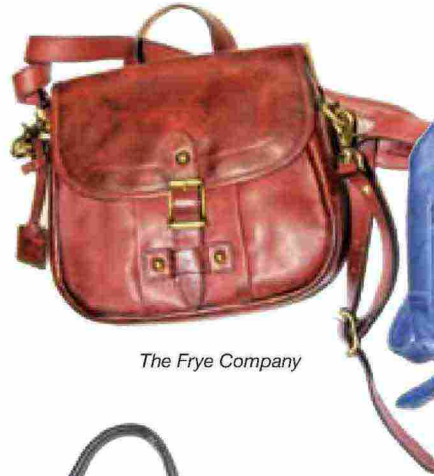
The Frye Company