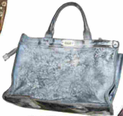
Vive la Difference