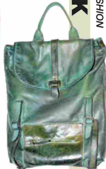
Vive la Difference