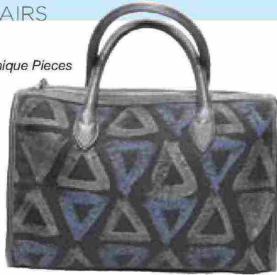
MSK Unique Pieces