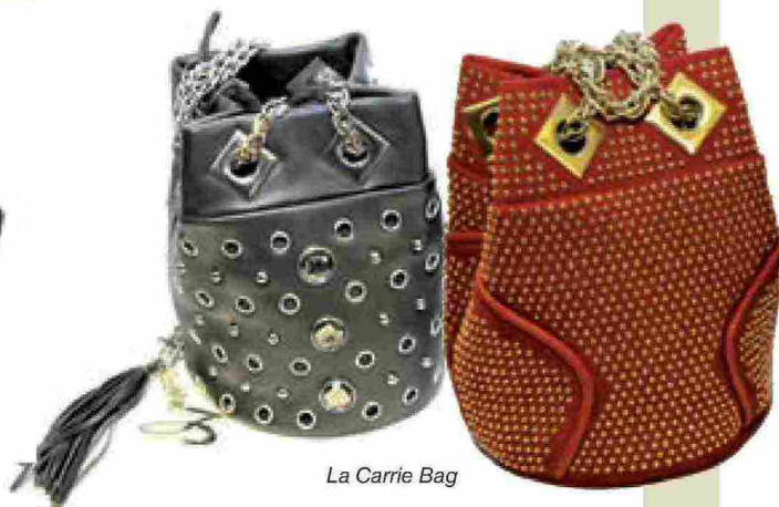
La Carrie Bag