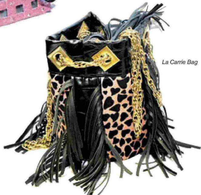
La Carrie Bag