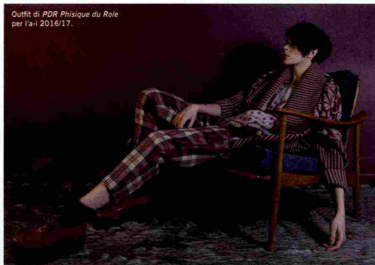
Outfit di PDR Phisique du Role per l'a-i 2016/17.

Al-Ma tel. +39 059 644141 www.phisiquedurole.com