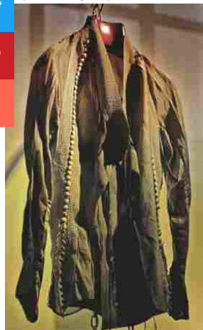
Nell'immagine una proposta di LIBORIO

quello con gli ospiti di White Man &amp; Woman è un appuntamento chiave per gli addetti ai lavori. Selezionati in