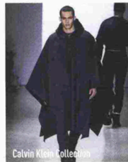
Calvin Klein Collection