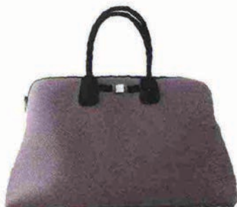
SAVE MY BAG

Save My Bag punta a ripetere il successo del modello Icon con la nuova Principe, che dopo la ribalta di Pitti Uomo ha fatto il suo esordio a Super, declinata al femminile. Stesso tessuto, l'innovativo Poly-fabric con Lycra, ultramorbido e leggero, stessa cura nella produzione, 100% made in Bergamo, dove ha sede l'azienda, che in tre anni ha triplicato il fatturato a 4,5 milioni di euro.