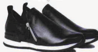
STRETCH YOUR LIFE