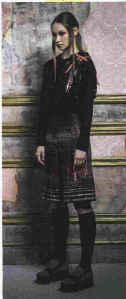
TC EXENCE (CAPSULE DI TRICOT CHIC)