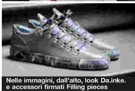
Nelle immagini, dall'alto, look Da.inke. e accessori firmati Filling pieces