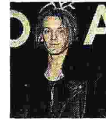
Attore Jamie C. Bower da Hogan