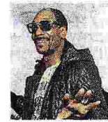
Rapper Snoop Dogg da Plein

anche in chiese sconsacrate (sabato Piquadro in San Carpoforo), nelle ex aree industriali (con la rassegna White in via Tortona), nei vecchi cinema. E oggi si riparte. Con Emporio Armani in via Bergognone, Fratelli Rossetti in via Cino del Duca, l'attesissimo show di Marcelo Burlon stasera in viale della Liberazione (party a seguire). Umore positivo nonostante la crisi. Con tanto di brindisi, ieri all'hotel Armani, organizzato dalla Camera della Moda.