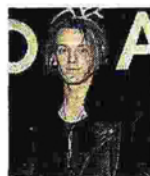
Attore Jamie C. Bower da Hogan