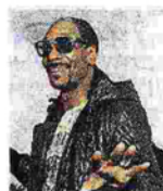
Rapper Snoop Dogg da Plein