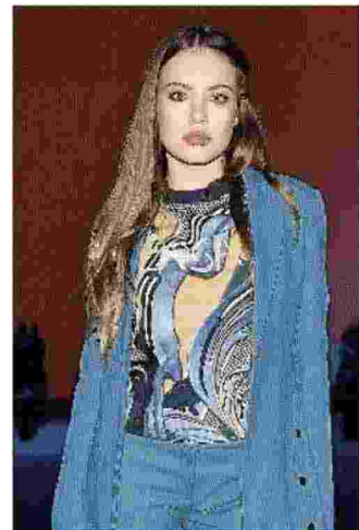
La top model Xenia Tchoumi