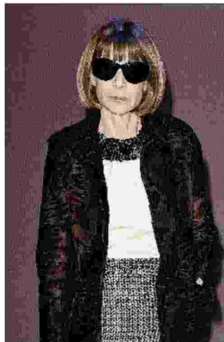
Anna Wintour, direttore Vogue America