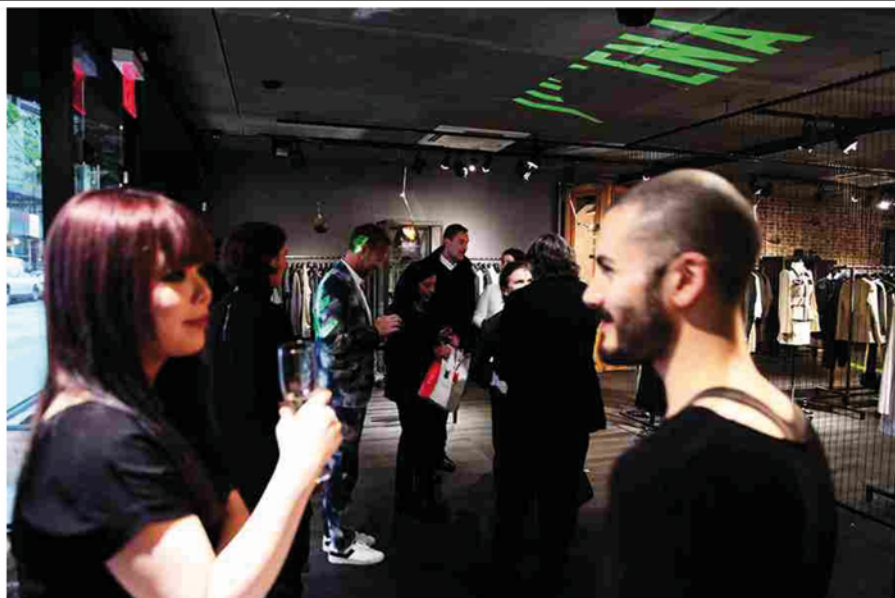
Il brand Ssheena protagonista dei trunk show di Time Award a Los Angeles e New York

Protagonista dei due trunk show negli States è stato SSheena , marchio creato da Sabrina Mandelli (vincitore del premio speciale Time 2016, messo in palio da ITA) che il 20 aprile ha presentato la sua collezione primavera/estate 2017 a Los Angeles, da H LORENZO , uno dei più importanti multibrand al mondo, e il 26 aprile da HOTOVELI , prestigioso concept store nel cuore del Village newyorkese.