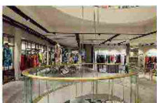
Chiude Excelsior Verona 7 gennaio 2016