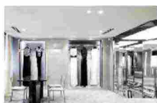
Riapre a Parigi il Couture Salon di Azzaro 20 febbraio 2016