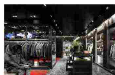
Moncler apre un nuovo store a Vancouver 22 dicembre 2015