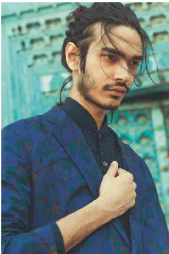
AUTUMN/WINTER COLLECTION 2017