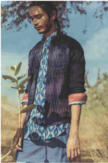
AUTUMN/WINTER COLLECTION 2017