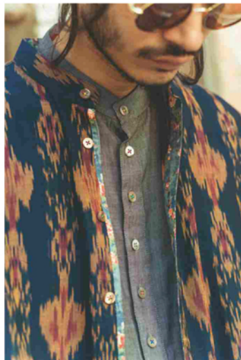
AUTUMN/WINTER COLLECTION 2017