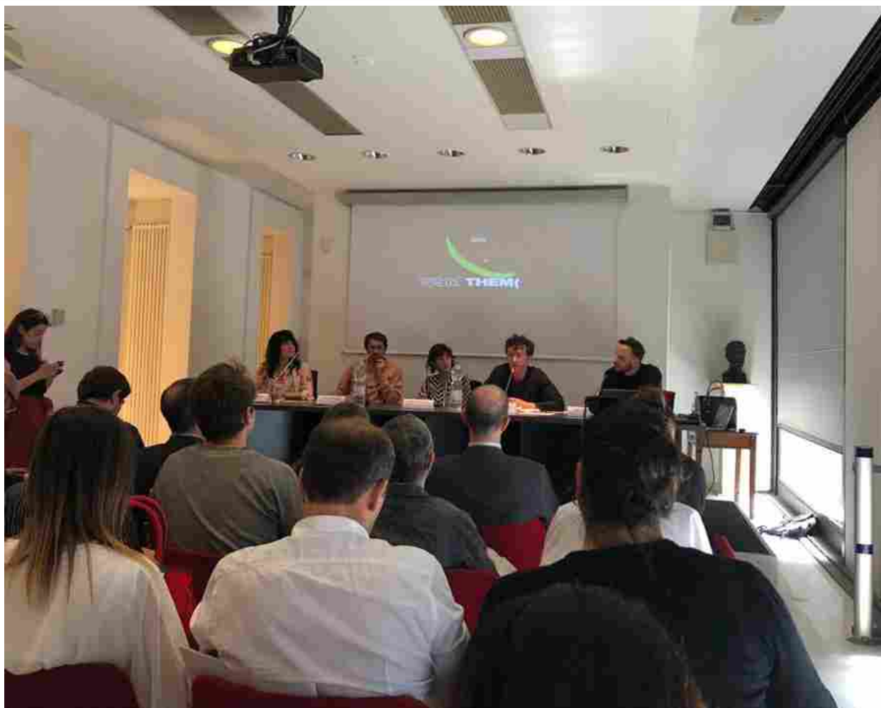
La conferenza di Presentazione del White Street Market a Palazzo Morando

Non solo collezioni, ma workshop, mostre ed eventi musicali. In programma dal 16 al 18 giugno White inaugura “White Street Market”, una sezione dove sarà presente una selezione di top brand dello sportwear & streetwear.