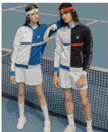
Un'immagine della collezione Sergio Tacchini x Andrea Crews