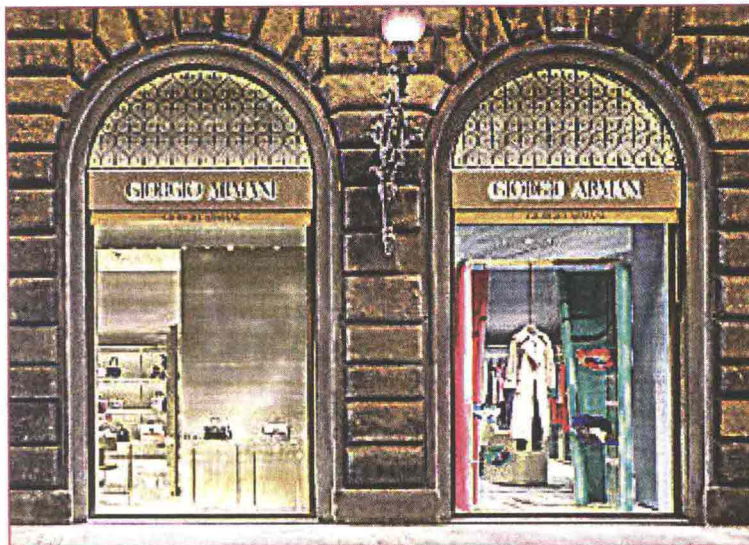
Alcuni scatti di due vetrine e degli interni della boutique di Firenze: «È nuova la presenza del corner dedicato interamente al make up e alle fragranze della linea Giorgio Armani Beauty»

«È sempre di moda, anche se cambiano proporzioni, tessuti, dettagli. Soprattutto, cambia il modo di indossarla accentuando i contrasti: formale/informale, sensuale/sportivo, maschile/femminile. È il senso del tempo a modularla, per questo è impossibile farne a meno».