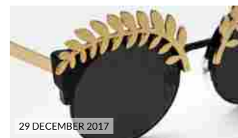
29 DECEMBER 2017 SUPER BY RETROSUPERFUTURE 10 anniversario: gli occhiali in limited edition