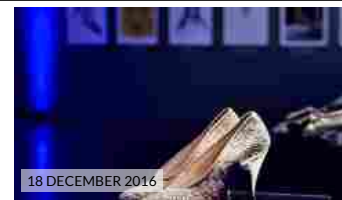
18 DECEMBER 2016 Fragiacomo 60 Anniversario: il libro fotografico, la mostra e la cena di gala