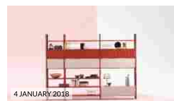
4 JANUARY 2018 IMM Cologne 2018: Novamobili presenta la nuova versione del sistema modulare Pontile