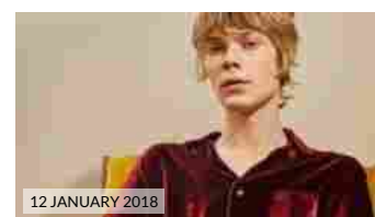
12 JANUARY 2018 Robert Cavalli TRIPLE RRR: la collezione autunno inverno 2018 2019