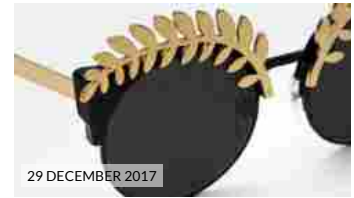
29 DECEMBER 2017 SUPER BY RETROSUPERFUTURE 10 anniversario: gli occhiali in limited edition