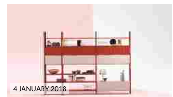
4 JANUARY 2018 IMM Cologne 2018: Novamobili presenta la nuova versione del sistema modulare Pontile