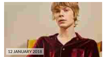
12 JANUARY 2018 Robert Cavalli TRIPLE RRR: la collezione autunno inverno 2018 2019