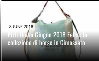
8 JUNE 2018 Pitti Uomo Giugno 2018 Fendi: la collezione di borse in Cimossato