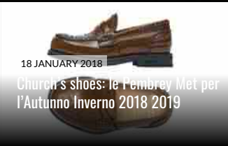
18 JANUARY 2018 Church's shoes: le Pembrey Met per l'Autunno Inverno 2018 2019