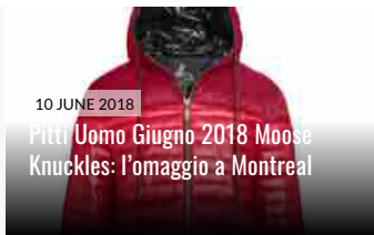
10 JUNE 2018 Pitti Uomo Giugno 2018 Moose Knuckles: l'omaggio a Montreal