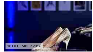
18 DECEMBER 2016 Fragiacomo 60 Anniversario: il libro fotografico, la mostra e la cena di gala