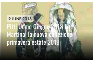
9 JUNE 2018 Pitti Uomo Giugno 2018 La Martina: la nuova collezione primavera estate 2019