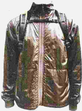
WOOLRICH GIACCA in tessuto tecnico performante per outdoor