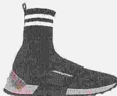
ALBERTO GUARDIANI SNEAKER One Soul versione calzino con coste e righe college