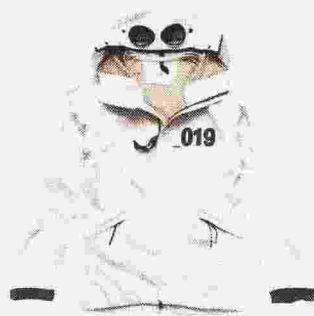
C.P. COMPANY ANORAK con cappuccio con goggle, zip sui polsi con bordi a contrasto