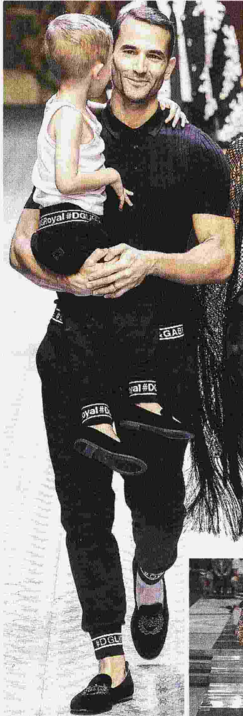
DOLCE&GABBANA LOGHI Polo a coste superlight, su pantaloni stretti sulle caviglie e bande con logo, per tutta la famiglia