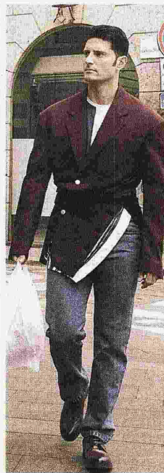
DIESEL TAGLI Giacca due bottoni dal taglio «sbagliato», su t-shirt, denim classici e boots con lacci