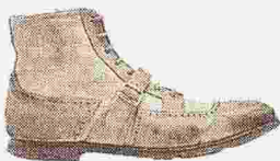
CHURCH'S SHANGHAI BOOT nei toni dell'avorio con inserti in lino naturale