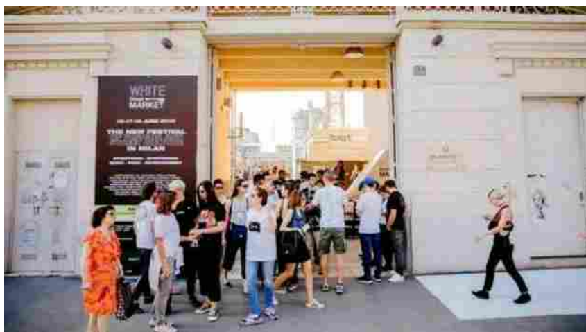
White Street Market

Ultimo aggiornamento: 19 giugno 2018 ore 16:47