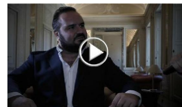
Gordini racconta Milano Wine Week. "Come un fuorisalone"