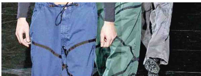
LO STILE Modelli che sfilano per Giorgio Armani in una delle ultime passerelle del grande maestro della moda