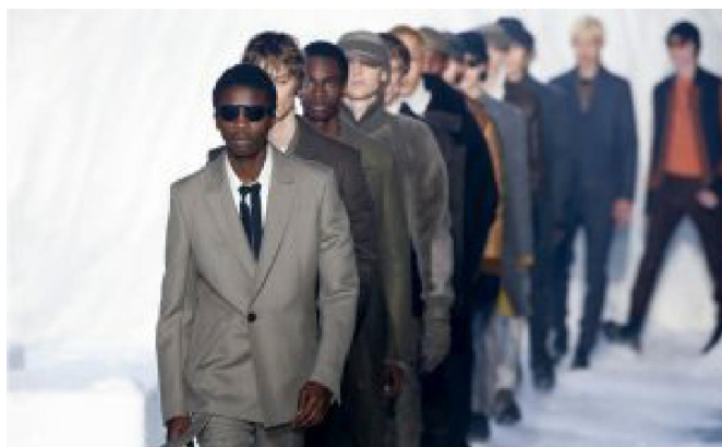
Il finale della sfilata Emenegildo Zegna autunno inverno 2018-2019