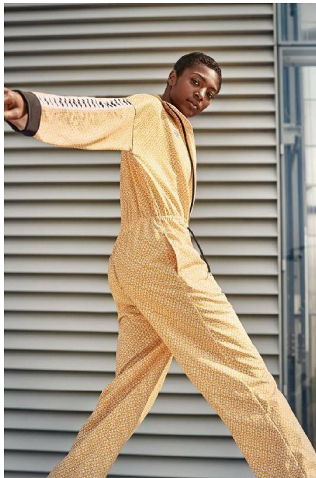
arena capsule collection Diamonds primavera-estate 2019

Non resta che andare a scoprire le novità di arena a White Street Market : l'appuntamento è a Superstudiopiù, nel cuore del Design District milanese dal 12 al 14 Gennaio 2019, in concomitanza con la settimana della moda maschile. Per la registrazione è possibile accedere direttamente all'area Save the Date tramite il link : https://www.whitestreetmarket.it/std