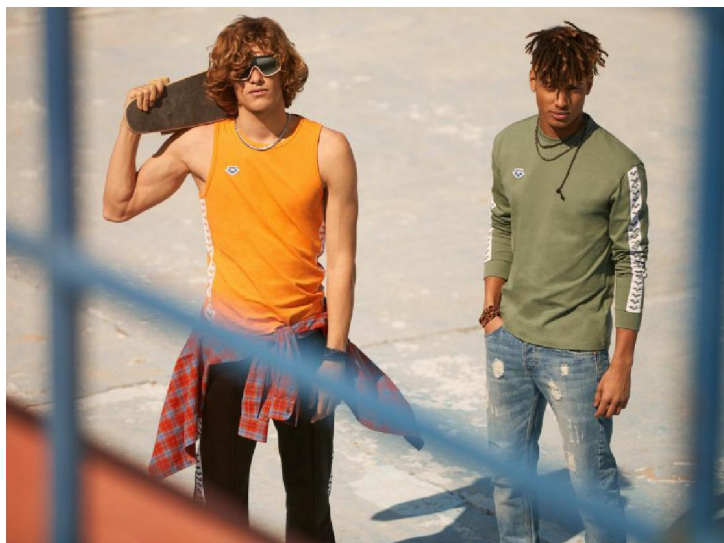
arena collezione ICONS primavera estate 2019

All'interno della collezione ICONS , arena ha anche sviluppato la capsule collection Diamonds , da scoprire in anteprima a White Street Market . Capi energici e accattivanti, ispirati allo sport ma perfettamente in sintonia con lo stile di vita delle giovani generazioni, in cui il primo e originale logo arena diventa stampa all-over a contrasto.