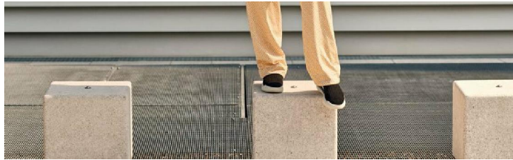
arena capsule collection Diamonds primavera-estate 2019