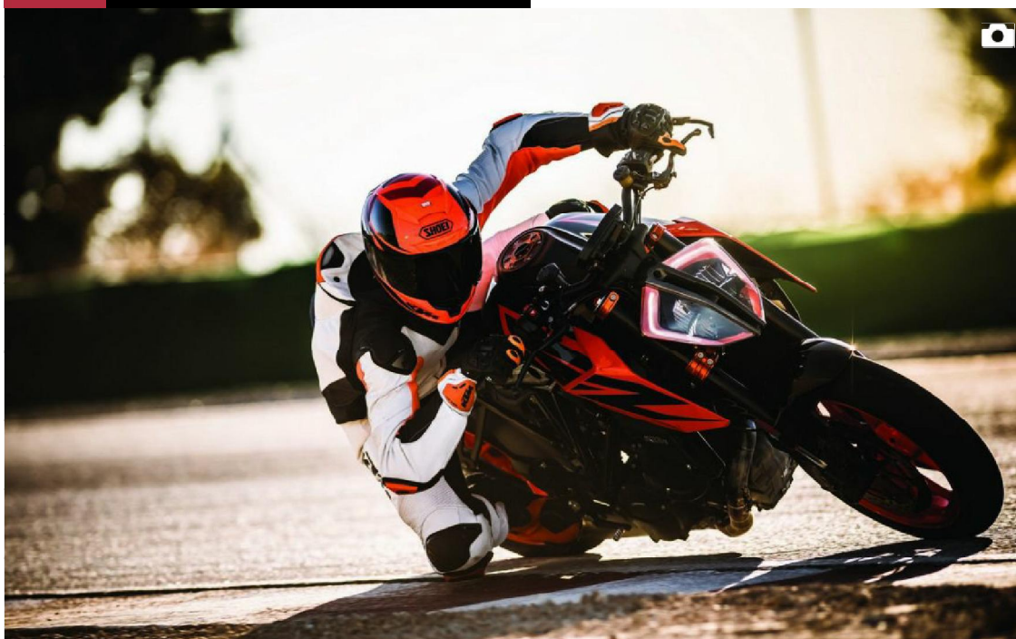
KTM: le moto del Costruttore austriaco danno spettacolo al MBE di Verona [FOTO]