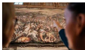
A FIRENZE MUSEI GRATIS PER LA DOMENICA METROPOLITANA