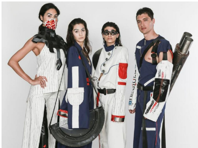
IL NETWORK DI AZIENDE

Nel corso del 2019 ci sarà poi un ulteriore incremento legato alla programmazione dei corsi finanziati dal Fondo Sociale Europeo, con particolare riferimento alla formazione professionale. In particolare verranno formati, nel biennio 2019/2020, circa 160 tecnici nelle aree della realizzazione di abbigliamento, calzatura, piccola pelletteria ed accessori, grafica pubblicitaria.