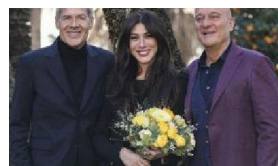
I CANTANTI TOSCANI IN GARA A SANREMO 2019