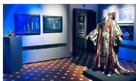
AL MUSEO ZEFFIRELLI VISITE GUIDATE GRATUITE