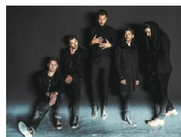
EDITORS IN CONCERTO A FIRENZE ROCKS 2019