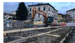
QUANDO FINIRANNO I LAVORI IN PIAZZA DELLE CURE?