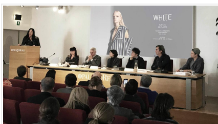
Un'immagine della conferenza White Milano