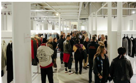
Un'immagine di White Milano

White Milano chiude l'edizione di febbraio registrando 25.256 (+4,8%) visitatori, tra buyer e operatori del settore. Tra questi, i buyer crescono del 2,3 per cento, grazie soprattutto alla spinta degli esteri, i quali hanno messo a segno un +6,8 per cento. Crescono, ma in maniera più contenuta, anche gli italiani (+1,4 per cento).