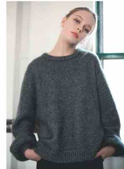
C.T. PLAGÉ @ WHITE La label giapponese distribuita da WP Lavori in Corso è l'espressione di un design essenziale, dalla vestibilità perfetta, in filati pregiati, anche di racoon tosato