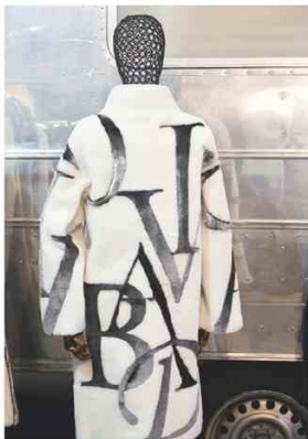
PUNTO @ THEONEMILANO Lettere cubitali e colori a contrasto come decorazione sul cappotto in pelliccia