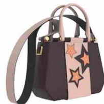
YOSONO BAGS @ WHITE Per donne ironiche e trasformiste, le borse di Silvia Scaramucci ispirate al Wild West