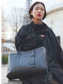
GEOFRE LONDON @ SUPER Soluzioni modulari per chi viaggia: una tote bag e una borsa esterna da indossare insieme o separatamente