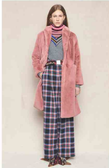
SHIRTAPORTER @ SUPER Prima volta al salone per il brand che del mix and match di tessuti, epoche e stili fa la sua sigla stilistica vincente