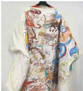
LUIGI BORBONE @ THEONEMILANO Art-à-porter: la cappa in duchesse di seta della maison romana è dipinta a mano con disegni della costellazioni