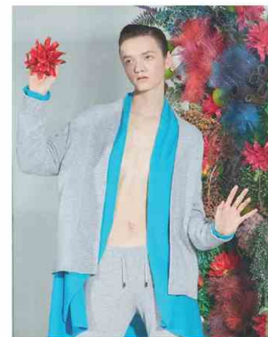
DUVET @ WHITE Dal know-how nella maglieria in cashmere di Giovanni Canessa, una collezione dalle linee pulite tutta made in Umbria