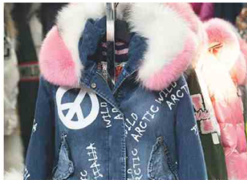
FLO&CLO @ THEONEMILANO Accenti pop e lettering per il giubbotto in jeans e collo in pelliccia del marchio di Fc Italia