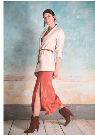
HANAMI D'OR @ WHITE Il marchio della veneta Asko propone un concetto di femminilità senza tempo, con cenni glam