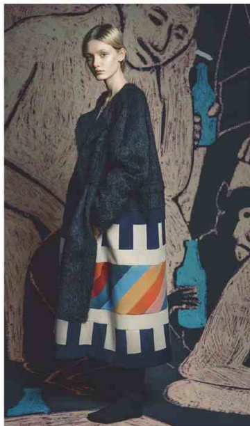
TRIINU PUNGITS @ WHITE La stilista estone reinventa l'outerwear con accostamenti audaci di colori e inediti patchwork di tessuti

Ai saloni milanesi una moda in technicolor, che non fa sconti alla voglia di osare, in un mix and match di stili e tendenze. Tra echi Seventies, spunti folk, suggestioni naturalistiche e romantici amarcord, il futuro si impone, motore di ricerca prezioso per volumi reinventati, tessuti inediti e performance high-tech