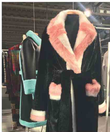
STAND @ SUPER Tra French attitude e purezza scandi, il brand svedese creato da Nellie Kamras nel 2014 reinventa le pellicce in versione eco