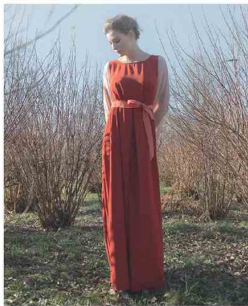
CHELIDONIA @ SUPER La collezione monoprodotta di abiti disegnati da Chiara Ciolli gioca con i colori della natura d'inverno