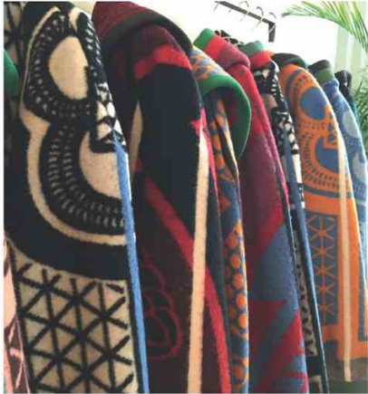
AVDOW @ WHITE Con il marchio di Anversa by Annick Van de Weghe le coperte della tribù Basotho diventano cappotti cocoon