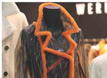
WERNER CHRIST @ THEONEMILANO Gioca sul vedo-non vedo il cappotto vestaglia in pvc, bordato di pelliccia arancione