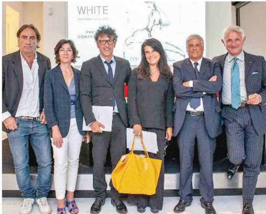
AL VIA La presentazione della serie di iniziative di White evento che attira sempre migliaia di fan del fashion