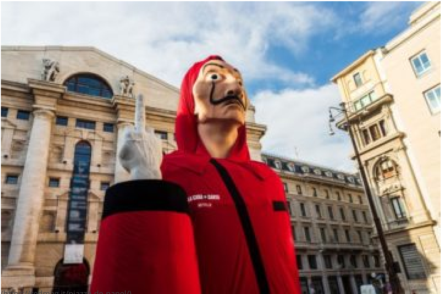
PIAZZA DE PAPEL ( https://redmag.it/piazza-de-papel/ ) NOEMI GDALETA ( https://redmag.it/author/admin/ ). x LUGLIO 18, 2019