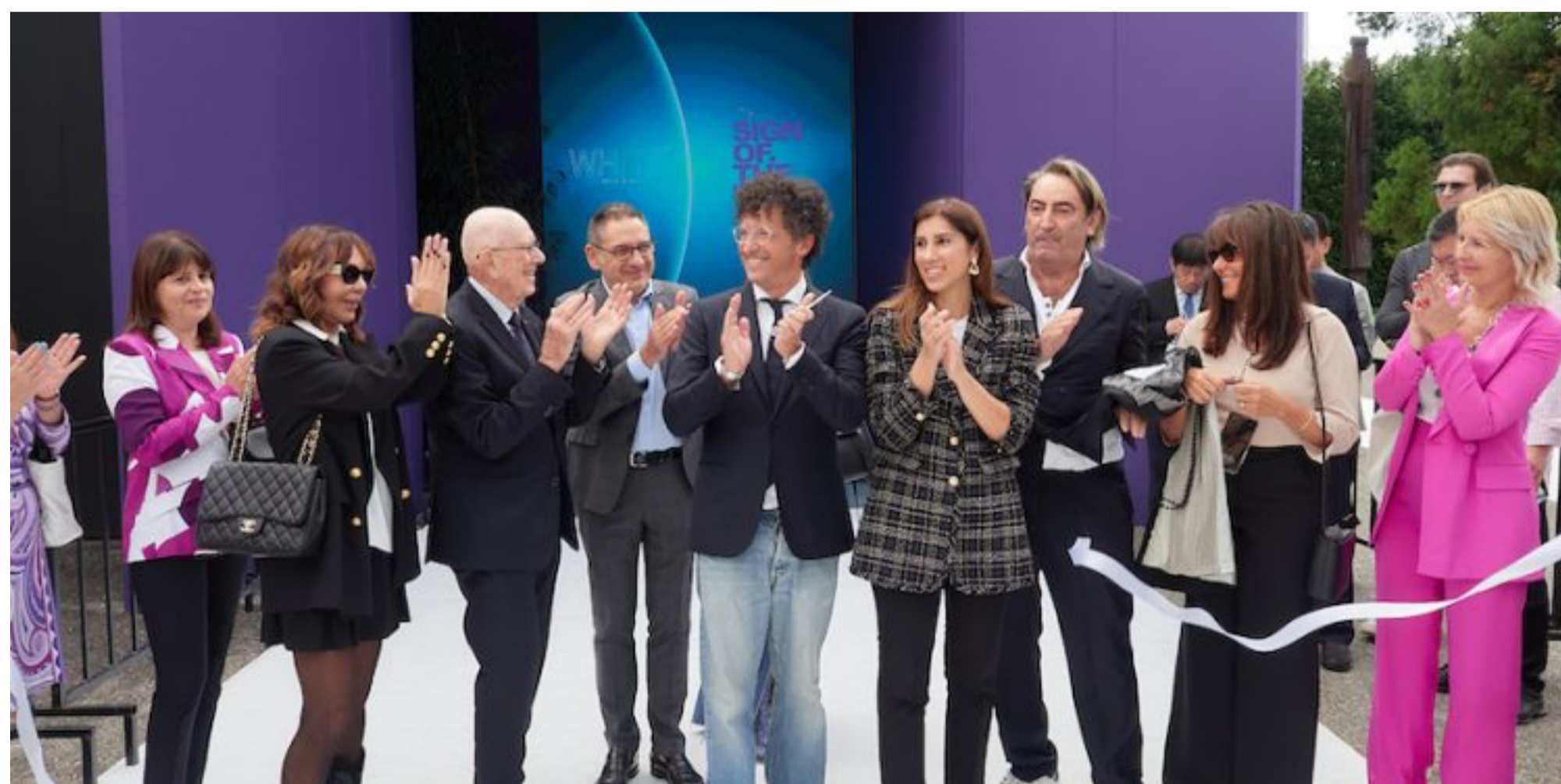
Il taglio del nastro della nuova edizione di White

Entra nel vivo la nuova edizione di White Milano . Inaugurato ieri, il content show, patrocinato del Comune di Milano , con il supporto del Ministero degli Affari Esteri e della Cooperazione Internazionale (MAECI) , di ICE – Agenzia per la Promozione all’Estero e l’Internazionalizzazione delle Imprese Italiane e con la partnership di Confartigianato Imprese , fino a domenica racconterà l’avanguardia creativa del prêt-à-porter femminile nel perimetro del Tortona fashion district. In scena oltre 300 aziende, più di un terzo delle quali inedite per White, distribuite tra gli spazi del Superstudio Più e del BASE Ex-Ansaldo, rispettivamente ai civici 24 e 54 di via Tortona.