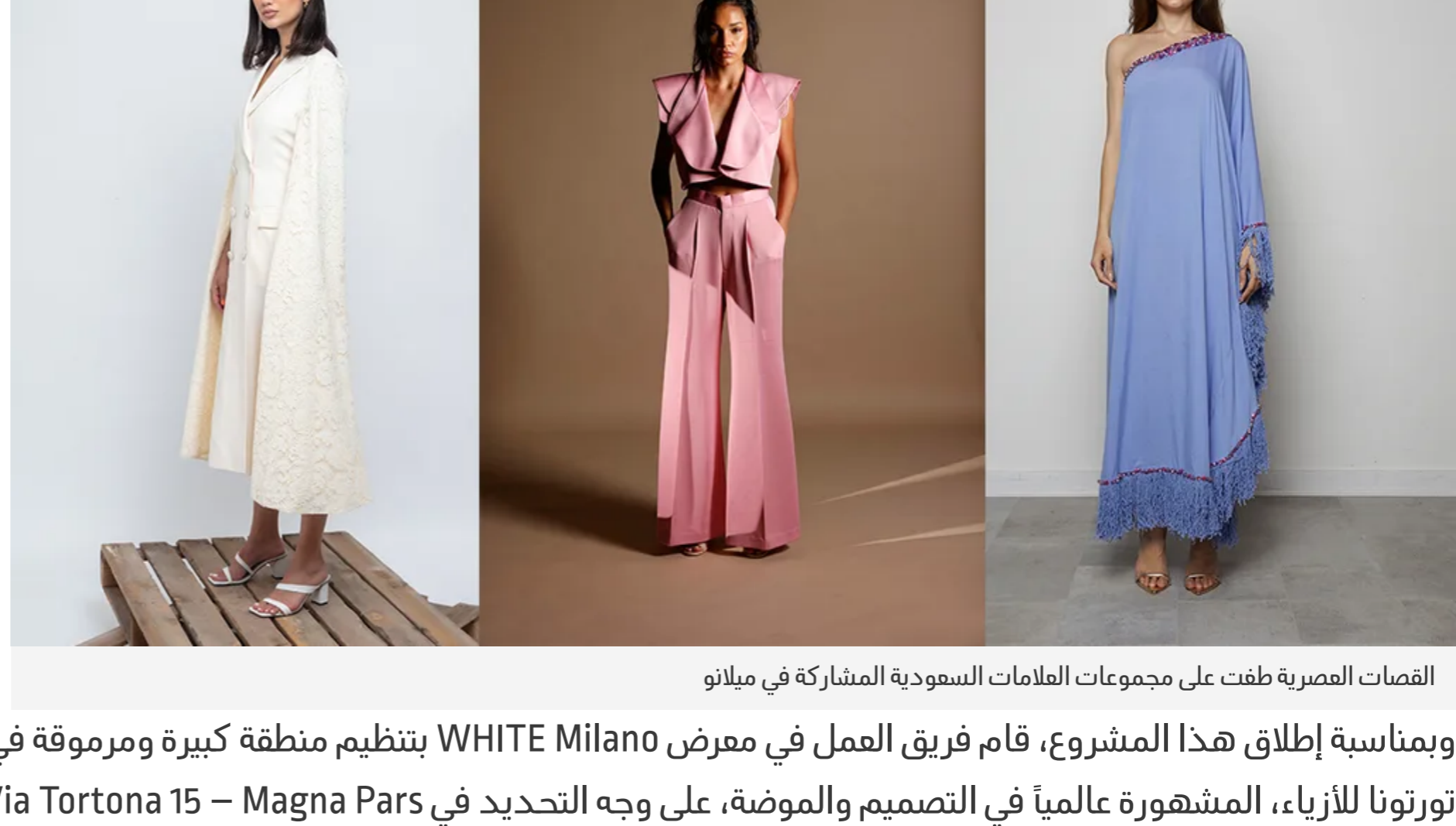
الضمان المصرية طقت على مجموعات العلامات السعودية المشاركة في ميلانو