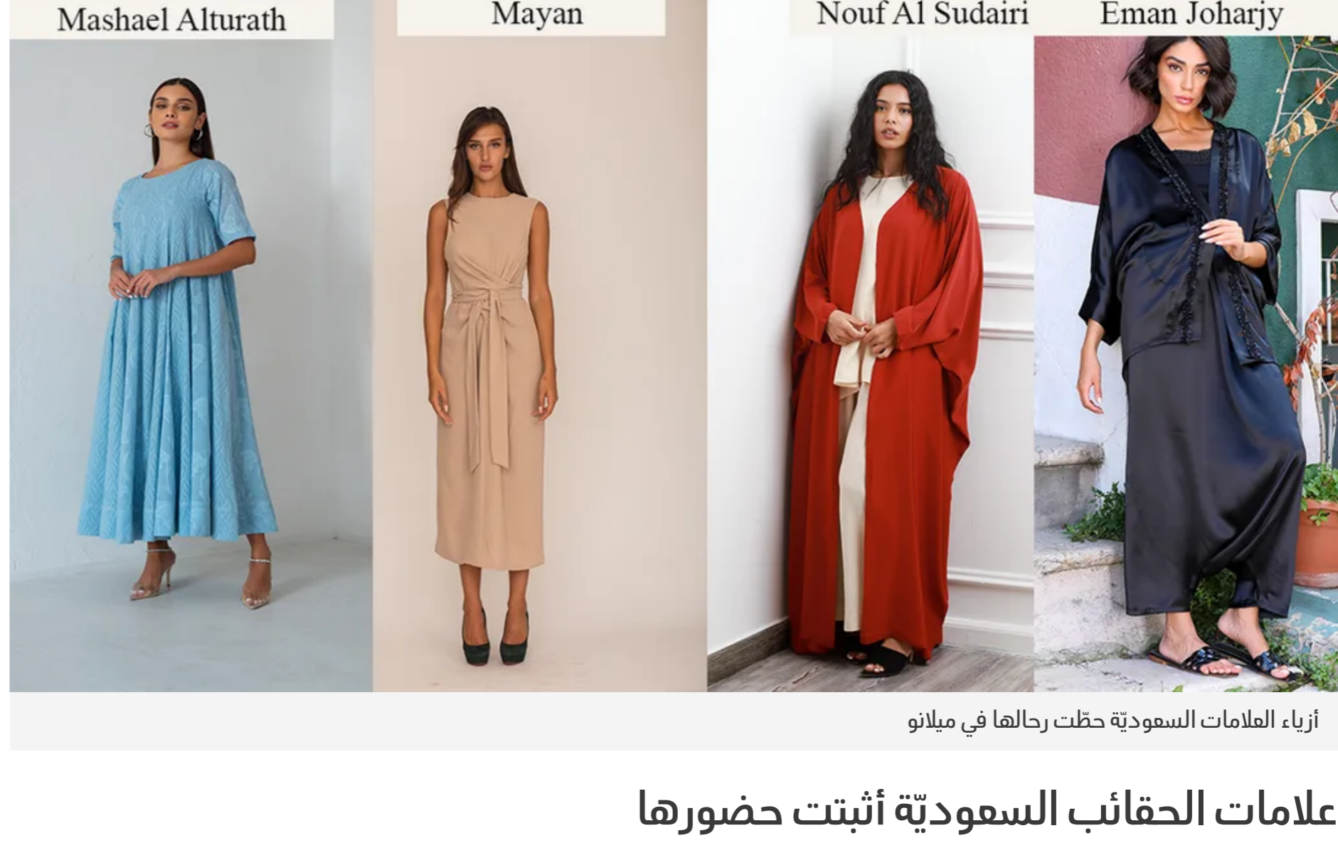
أزياء العلامات السعودية حظت بدعائها في ميلانو

المشاركة السعودية في المعرض أقيم على هامش أسبوع الموضة في ميلانو، لاقت نجاحاً كبيراً، نظراً للإبداع والتميز اللذين رافقا ما قدّمته المواهب السعودية ضمن علامتها للأزياء.