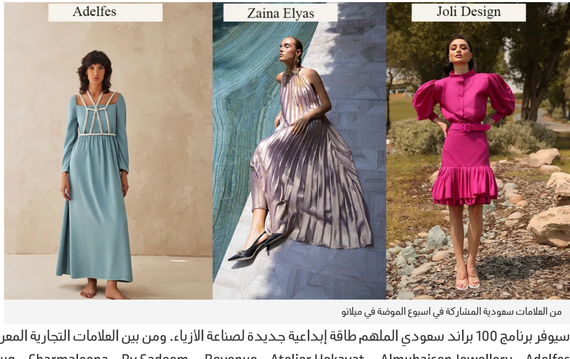
من العلامات السعودية المشاركة في اسبوع الموضة في ميلانو

هذا المشروع هو جزء من معرض ExpoWhite التابع لـ WHITE Milano، وهو يهدف إلى دعم المواهب الجديدة وجذب المنشترين الدوليين إلى أسواق الموضة الناشئة. وباعتبارها النسخة الأولى للمعرض هذا العام، سيدعم مشروع ExpoWhite أيضاً المصممين من البرازيل وهولندا وجنوب أفريقيا والمملكة العربية السعودية.