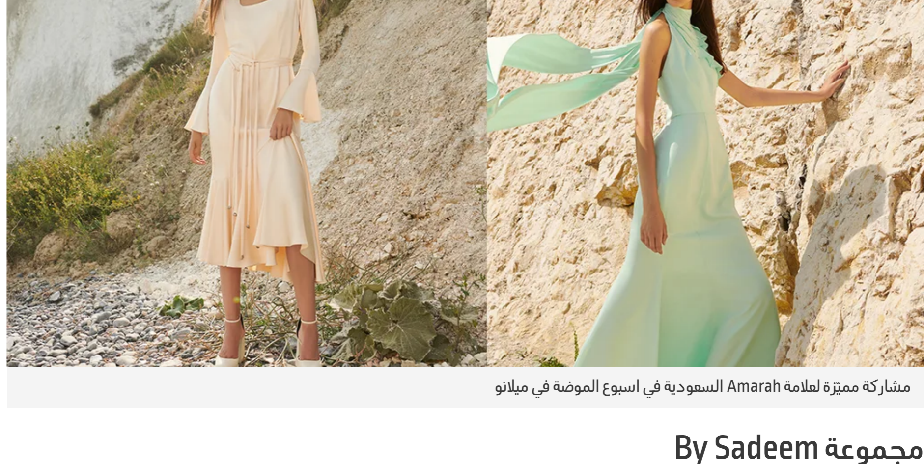
مشاركة مميزة لعلامة Amarah السعودية في اسبوع الموضة في ميلانو

Amarah هي من بين العلامات السعودية المشاركة في المعرض، وقد كشفت عن تصاميم بقضات أنثوية مريحة ضمن مجموعتها لربيع وصيف 2023، التي شكّلت لوحة صيفية ملهنة من ألوان الباستيل.