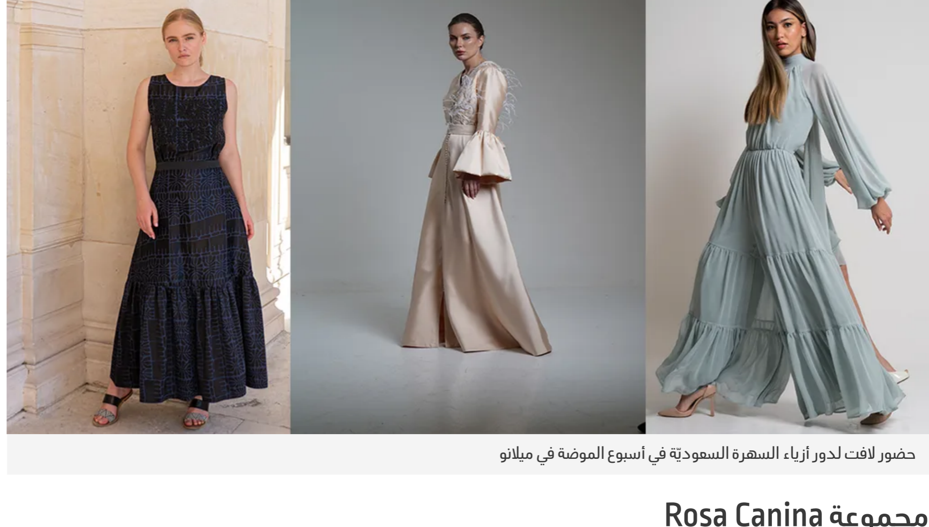
حضور لافت لحدور أزياء المصممة السعودية في اسبوع الموضة في ميلانو

وبمنااسبة إطلاق هذا المشروع، قام فريق العمل في معرض WHITE Milano بتنظيم منطقة كبيرة ومرموقة في قلب منطقة تورنتو للأزياء، المشهورة عالمياً في التصميم والموضة، على وجه التحديد في Via Tortona 15 – Magna Pars، وذلك لاستعراض جميع أعمال العلامات المشاركة. تم وضع نشانات المرص المبتكرة والحديثة من قبل WHITE، وتم تصميمها مع مراعاة الاستدامة البيئية.