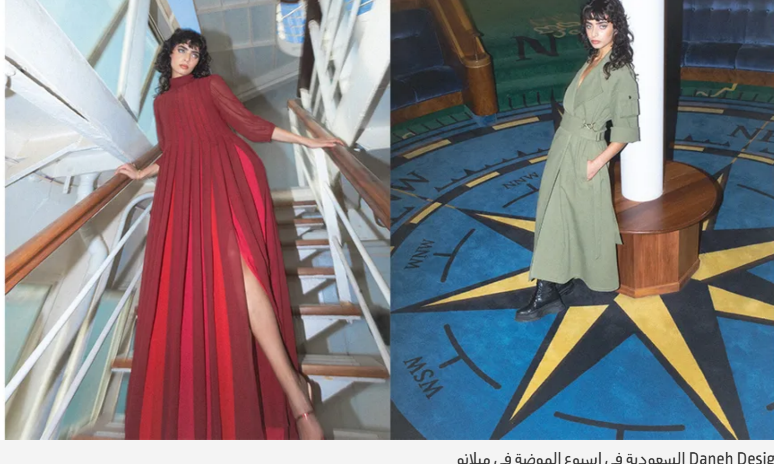
مشاركة Daneh Design السعودية في اسبوع الموضة في ميلانو

Daneh Design هي أيضاً من بين العلامات السعودية التي شاركت في المعرض، كاشفة عن مجموعة من التصاميم التي ضفت خيارات كاجوال مثالية للإطلالات اليومية، وأخرى في الإمكان التلق بها في المناسبات.