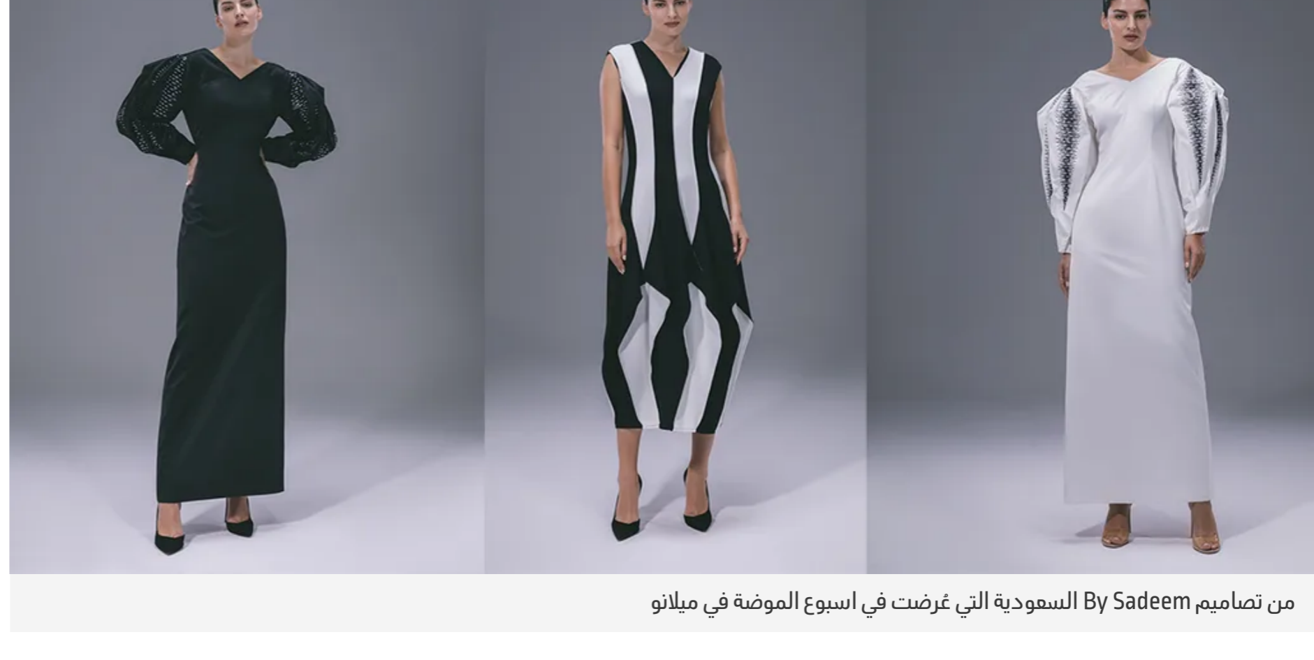
من تصاميم By Sadeem السعودية التي عُرضت في اسبوع الموضة في ميلانو

عكست علامة By Sadeem السعودية الإبداع، مع خلال أزياء تميّزت بتفاصيلها وقضائها المميّزة المبهدة عن المألوف، والتي نُفذت باستخدام أقمشة راقية انحصرت بلوني الأبيض والأسود.