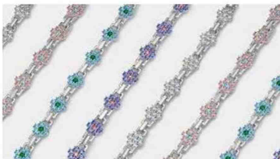
A destra la collezione estiva di 'Augua by Agua Bendita' A sinistra invece i gioielli della maison londinese Hatton Labs