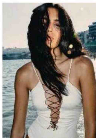
A White Resort la vetrina dedicata ai brand internazionali di abbigliamento, calzature e accessori beachwear